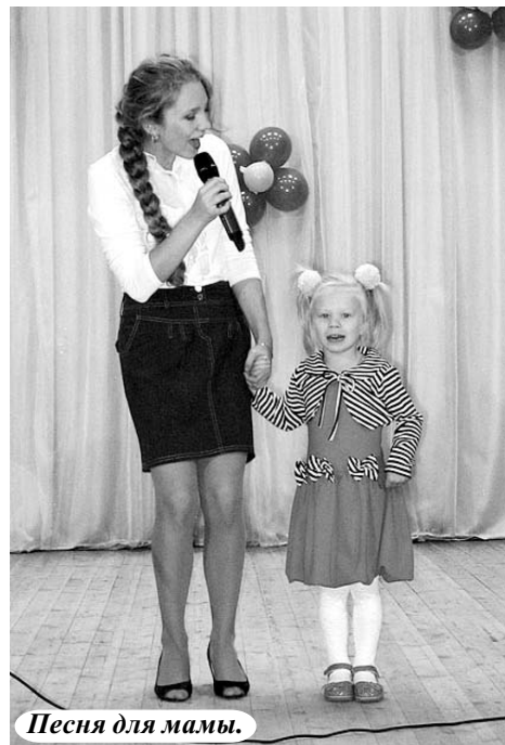
Песня для мамы.